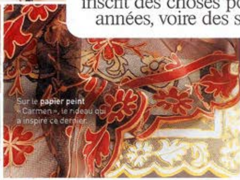
Sur le papier peint «Carmen», le rideau qui a inspiré ce dernier.