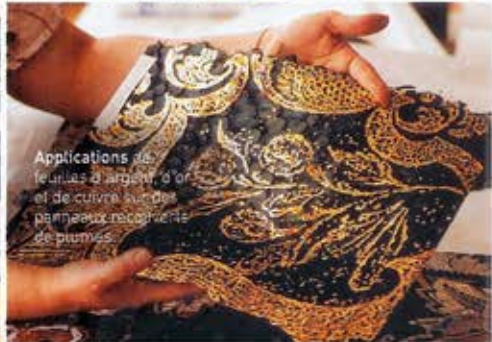
Applications de feuilles d'argent, d'or et de cuivre sur des panneaux décoratifs de plumes.

Anne Gelbard chez Ugly Home, 108, rue Saint-Honoré, 75001 Paris. Tél.: 01 40 26 18 51